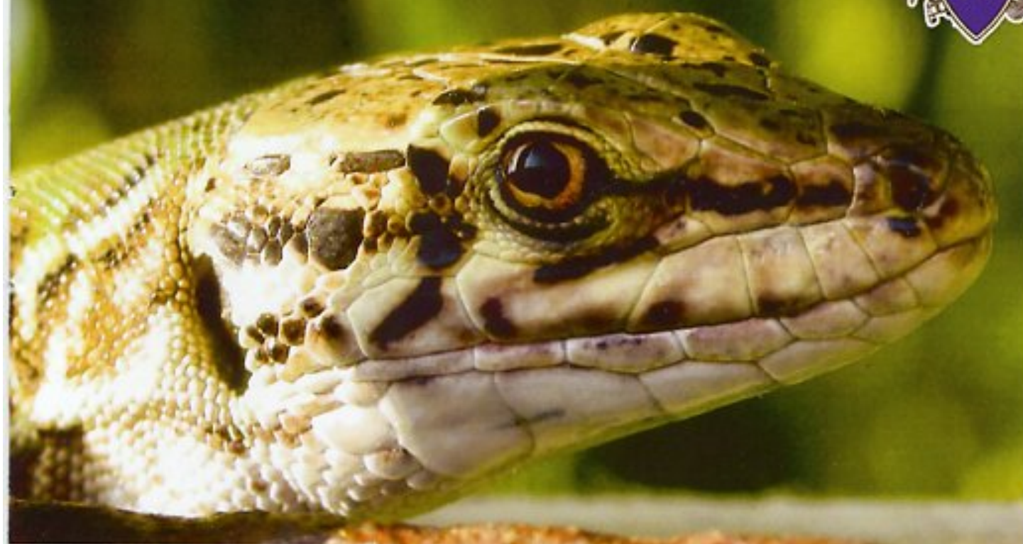
"Podarcis Sicula" - Walter Millemaci