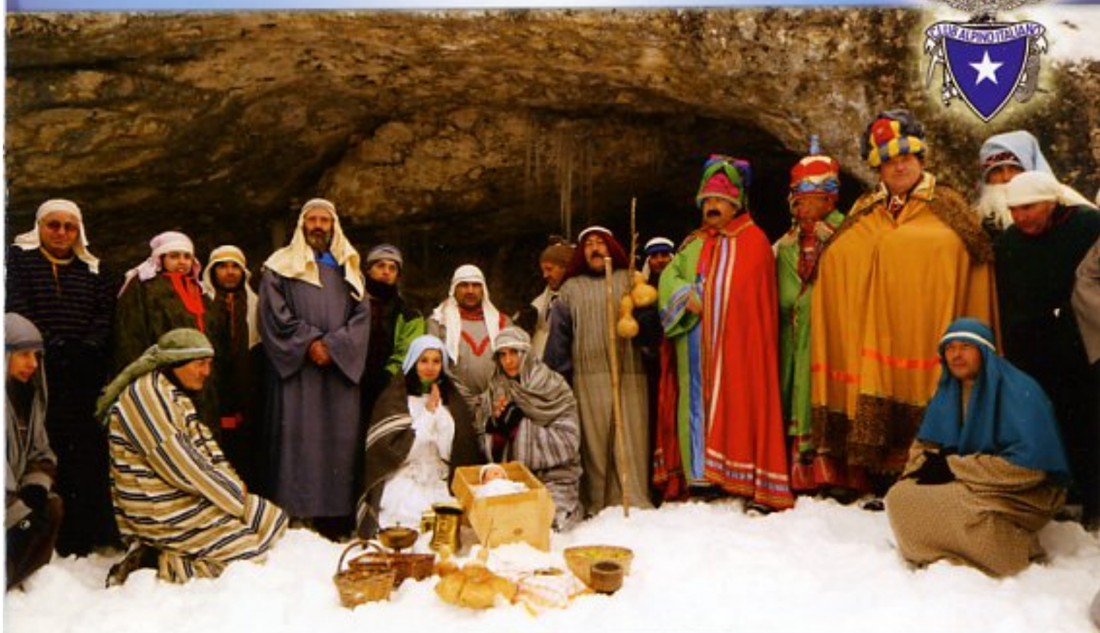
"Grotta della Valianara" - Luciano Torrieri