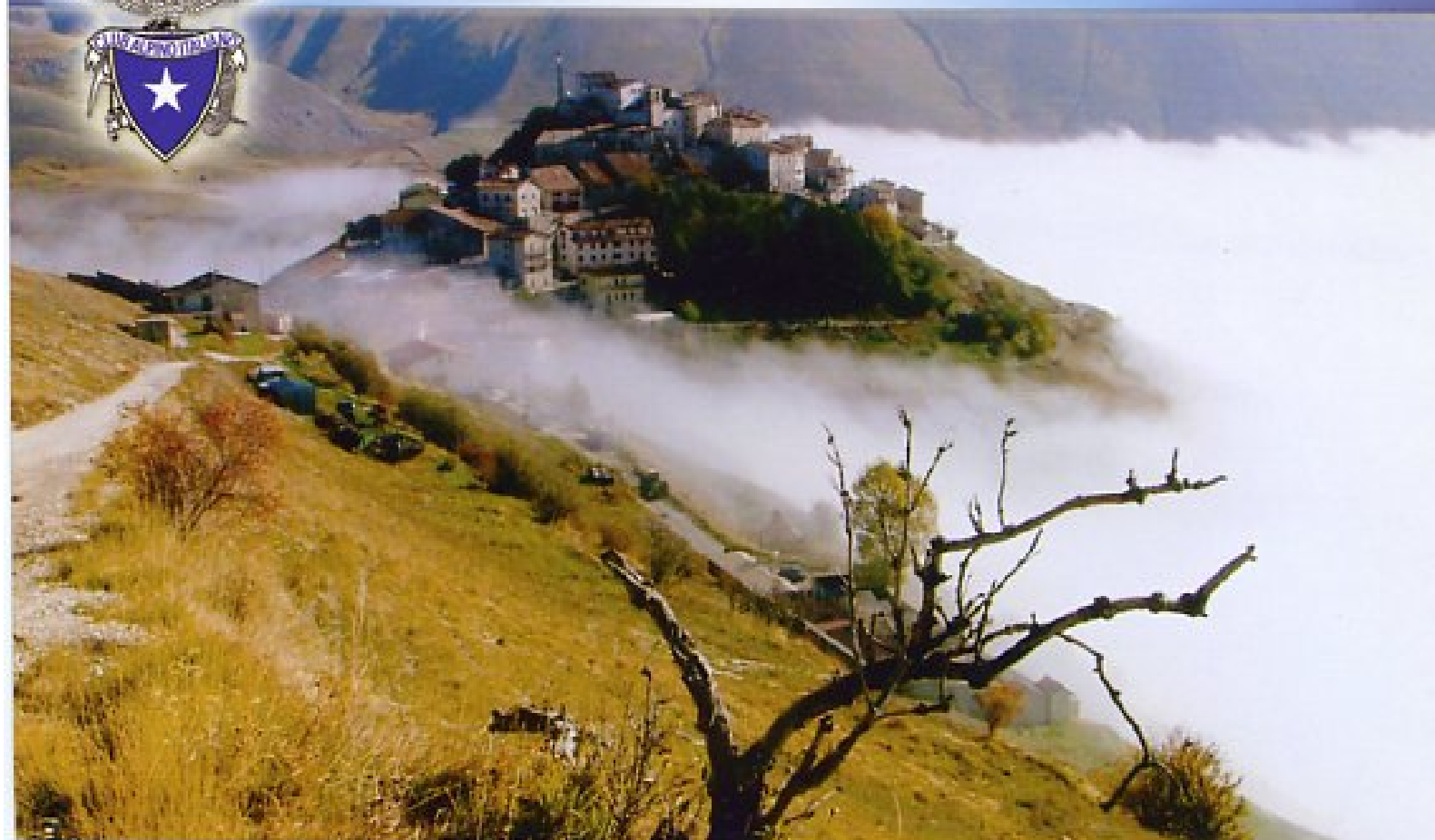
"Mattino a Castelluccio" - Elide Morelli