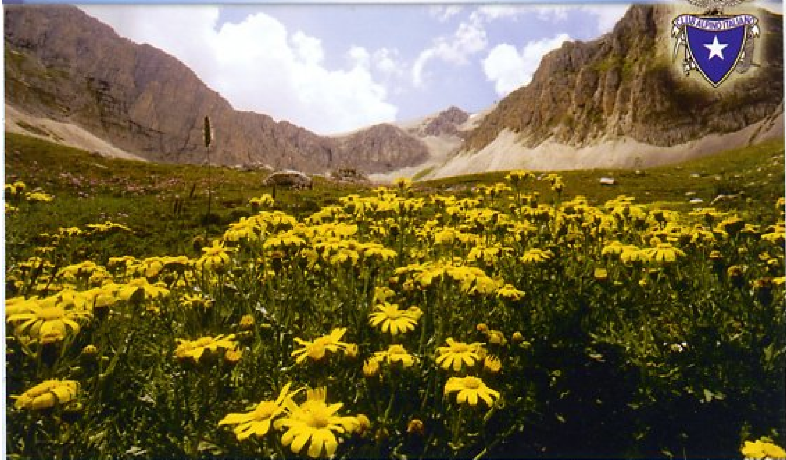
"Anfiteatro Murelle" - Luciano Torrieri