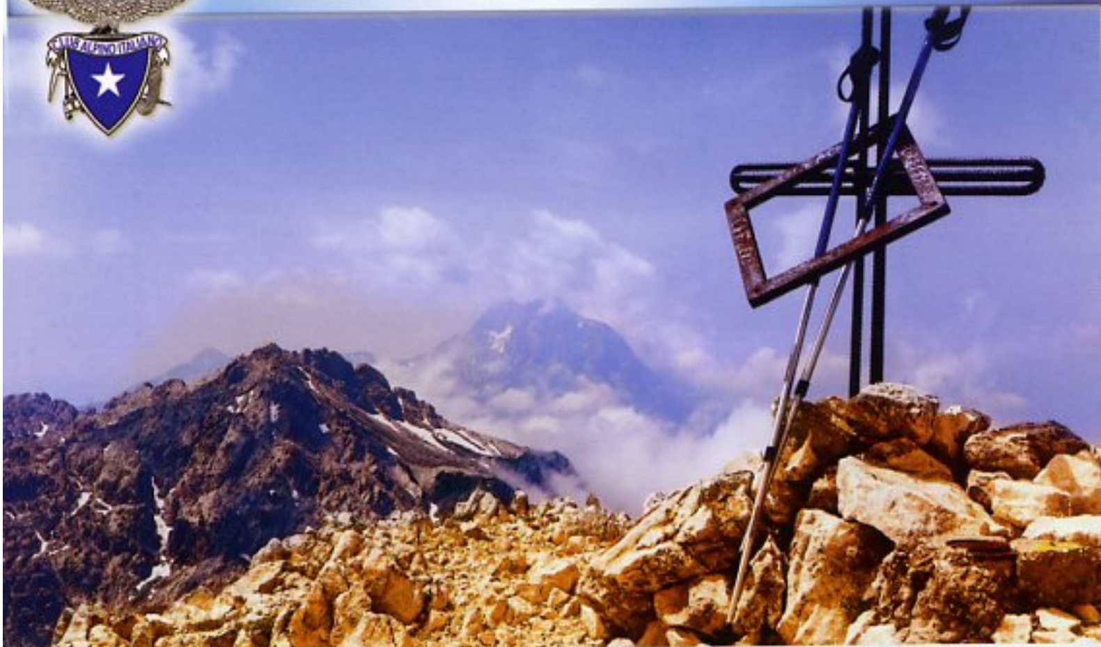
"Il Monte Camicia" - Massimo Zulli